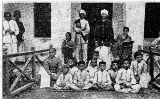
Elever vid dövstumskolan i Mysore.

För ett halvt århundrade sedan var ingenting känt i Indien om de dövas och de blindas undervisning. Till och med i våra dagar anses det i Indien som ett underverk att döva kunna undervisas. Över 90 proc. av den vanliga befolkningen i Indien är fullständigt okunnig om att de döva