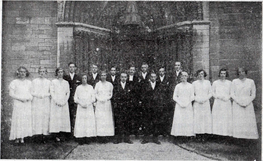
Årets konfirmander i Örebro.

Hon läste länge och innerligt, och Stor-Anders sade inte ett ord.