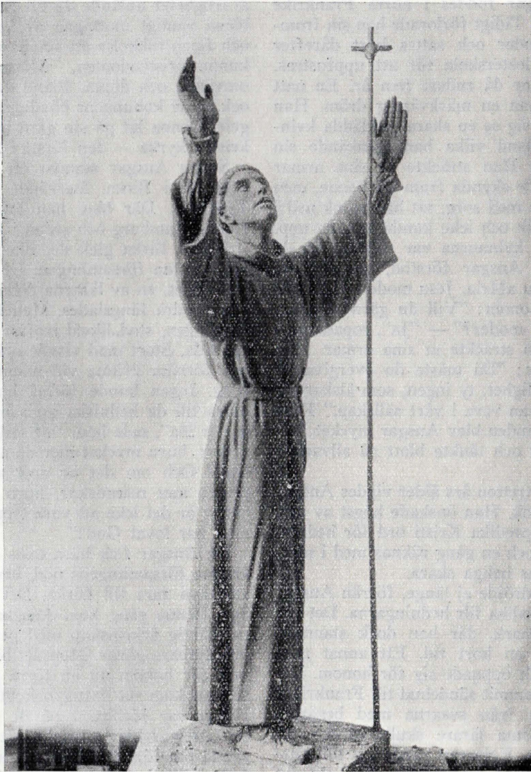
Konstnären Carl Eldhs skulptur av Ansgar. Ansgarkapellet å Björkö.